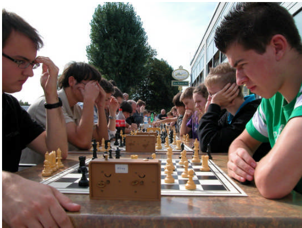
Langsam rauchen die Köpfe.