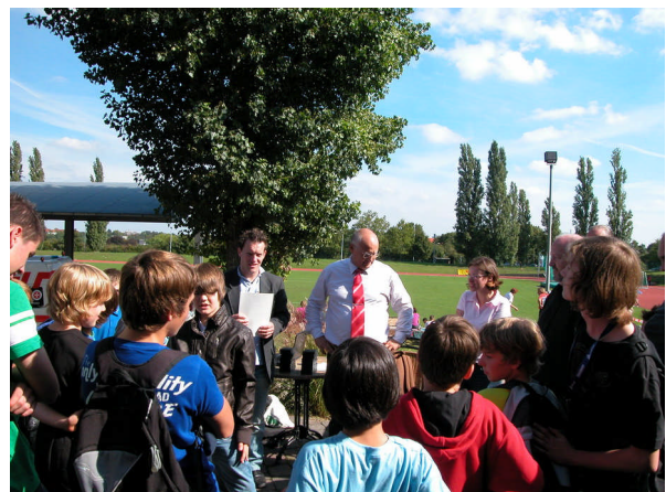
Am Nachmittag begannen die zahlreichen Siegerehrungen, so wie hier beim Schach.