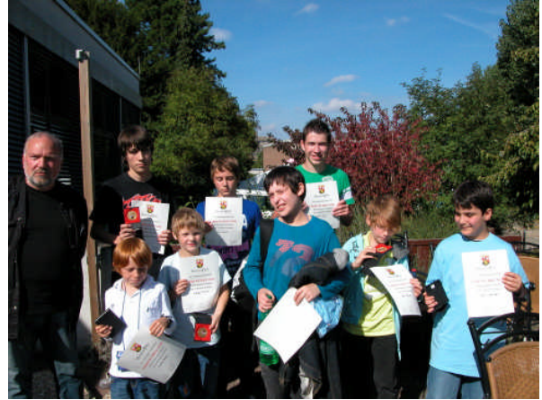
...und der Pfalz

Leider war die Mannschaft aus dem Rheinland zu diesem Zeitpunkt bereits abgereist.