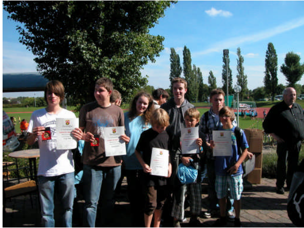
Die Mannschaft Rheinhessens...