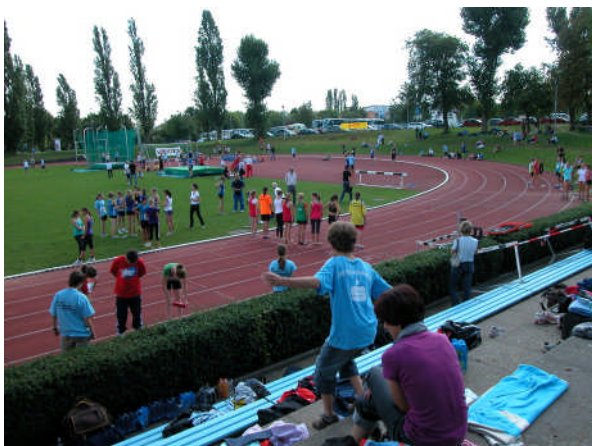
Zwischendurch gab es immer mal wieder Zeit, sportliche Glanzleistungen in den Lauf- und Sprungwettbewerben zu beobachten